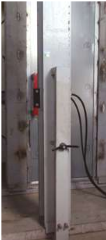
Essais statiques selon la norme EN 1628