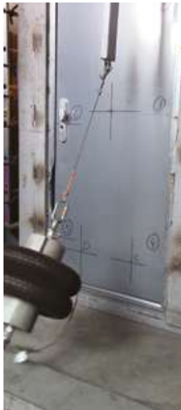
Essais dynamiques selon la norme EN 1629